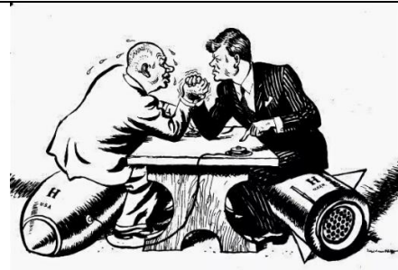
Британская карикатура на Карибский кризис